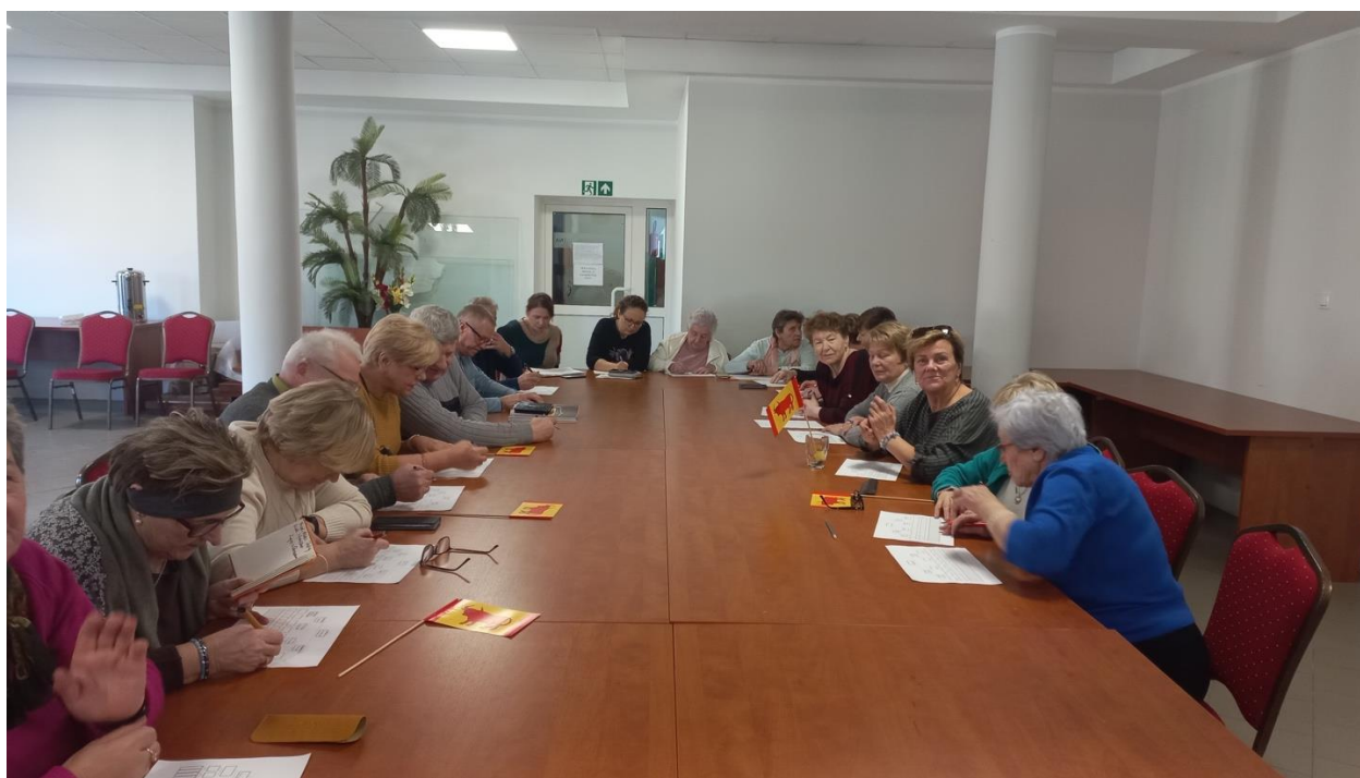
Fot. Wiscy seniorzy w czasie uzupełniania szkiców drzew genealogicznych

Wiscy seniorzy wezmą udział w konkursie genealogicznym, który ma ich zmobilizować do poszukiwań własnych i przeglądnięcia albumów i pamiątek rodzinnych. Rozstrzygnięcie konkursu nastąpi w połowie marca 2024 r.