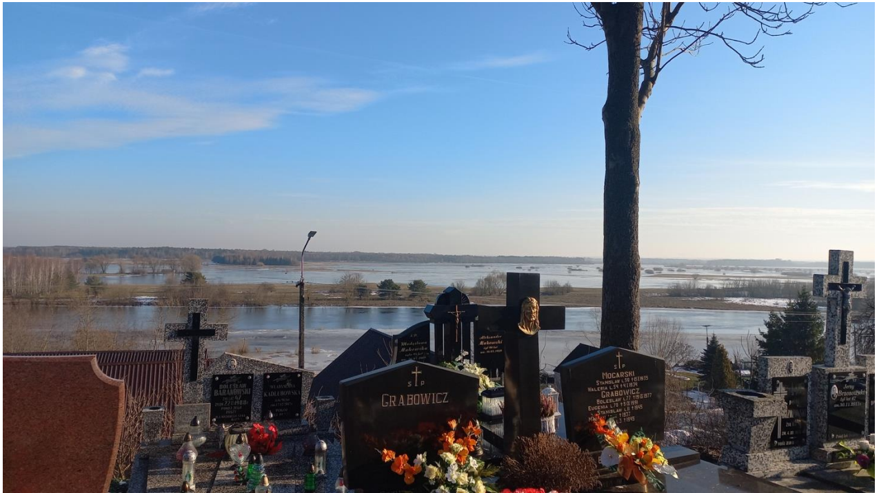
Fot. Cmentarz w Wiźnie – muzeum pod gołym niebem i warta świadomego poznania przestrzeń identyfikacji tożsamości rodów i rodzin wiskich