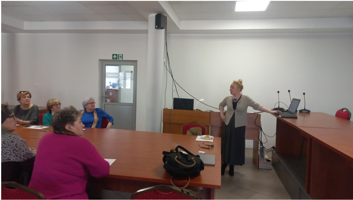
Fot. Dr Małgorzata K. Frąckiewicz wyjaśnia pochodzenie nazwisk, które identyfikują rody i rodziny wiskich seniorów.