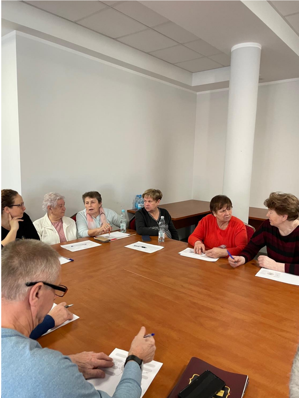
Fot. Uczestnicy warsztatów zastanawiają się, co odziedziczyli po przodkach.