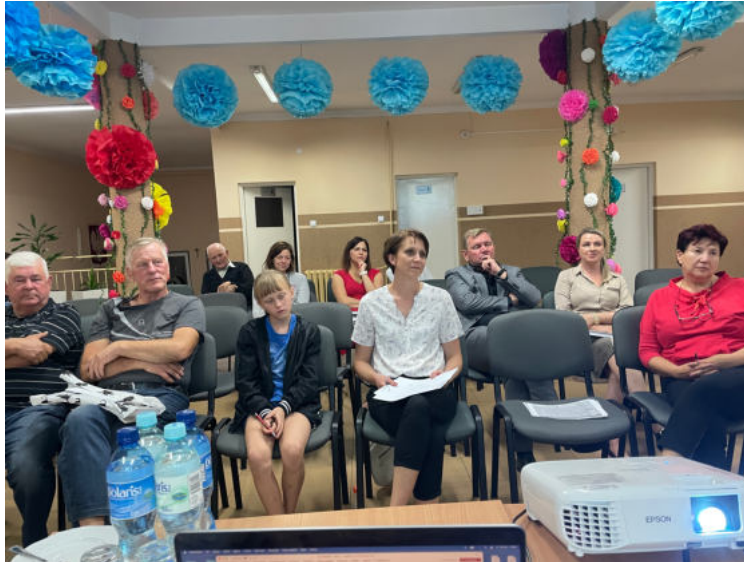
Fot. Uczestnicy spotkania w Rutkach-Kossakach