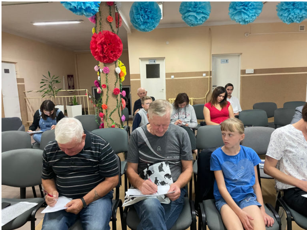
Fot. Przedstawiciele rodzin rutkowskich w trakcie odtwarzania drzewa genealogicznego własnych rodów