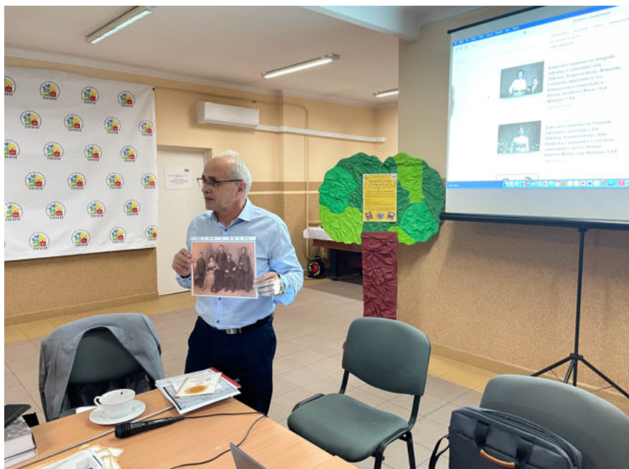
Fot. Tadeusz Trepanowski – współprowadzący spotkanie genealogiczne