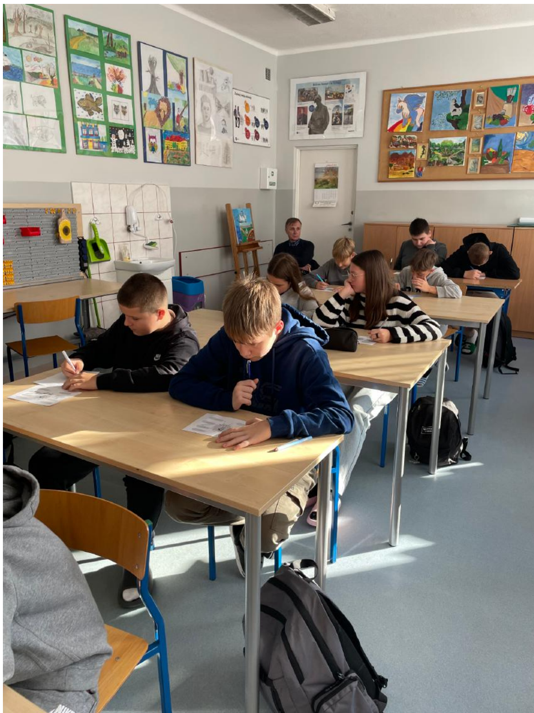
Fot. Uczniowie identyfikujący swoje podobieństwo do przodków