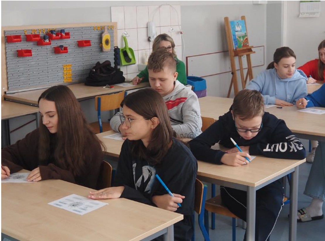
Fot. Uczniowie identyfikujący swoje podobieństwo do przodków