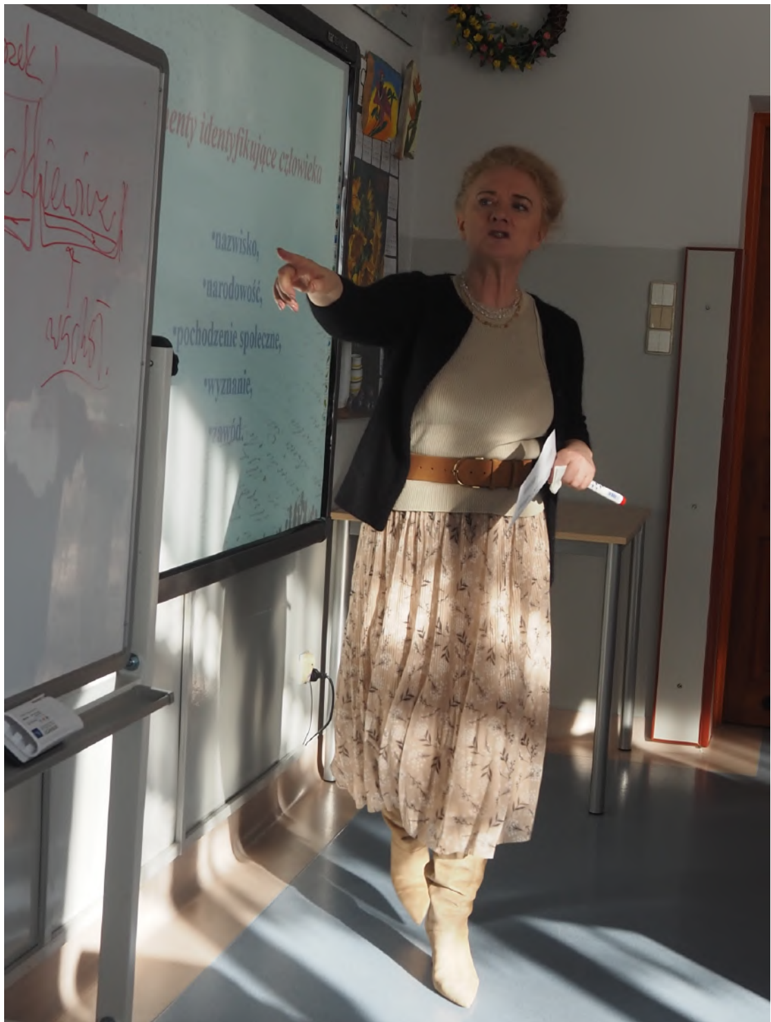
Fot. Dr M. Frąckiewicz objaśniająca słowotwórczą budowę nazwisk i interpretująca znaczenie podstawy słowotwórczej i formantów wybranych oniów