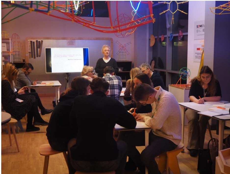
Fot. Zgromadzeni na warsztatach w Akademii Łomżyńskiej