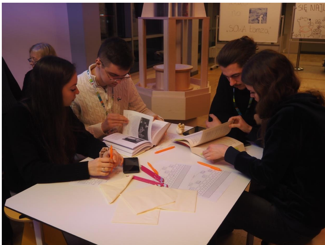
Fot. Młodzi przedstawiciele rodów i rodzin łomżyńskich zaangażowani w odkrywanie dziejów swoich rodzin.