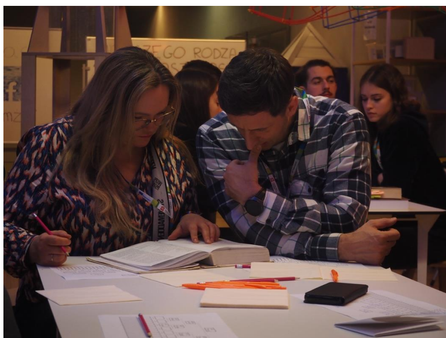
Fot. Państwo szukający informacji o etymologii nazwisk swoich przodków.