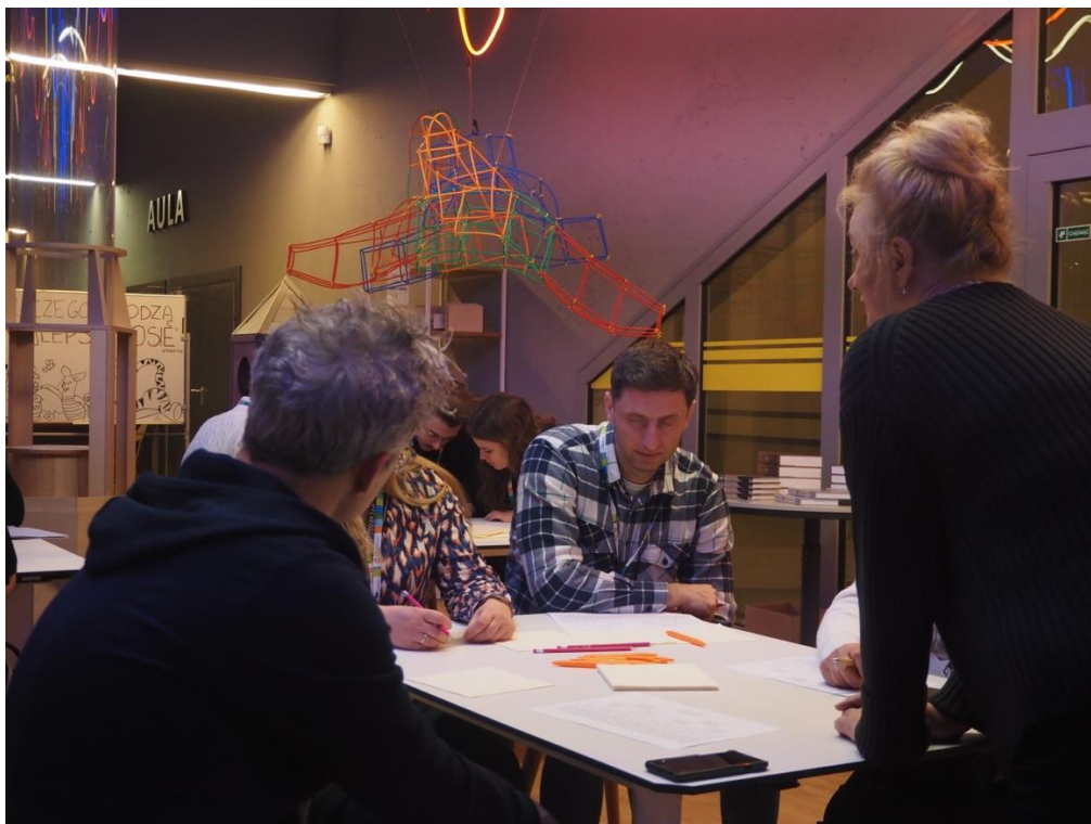
Fot. Rozmowy i konsultacje indywidualne...