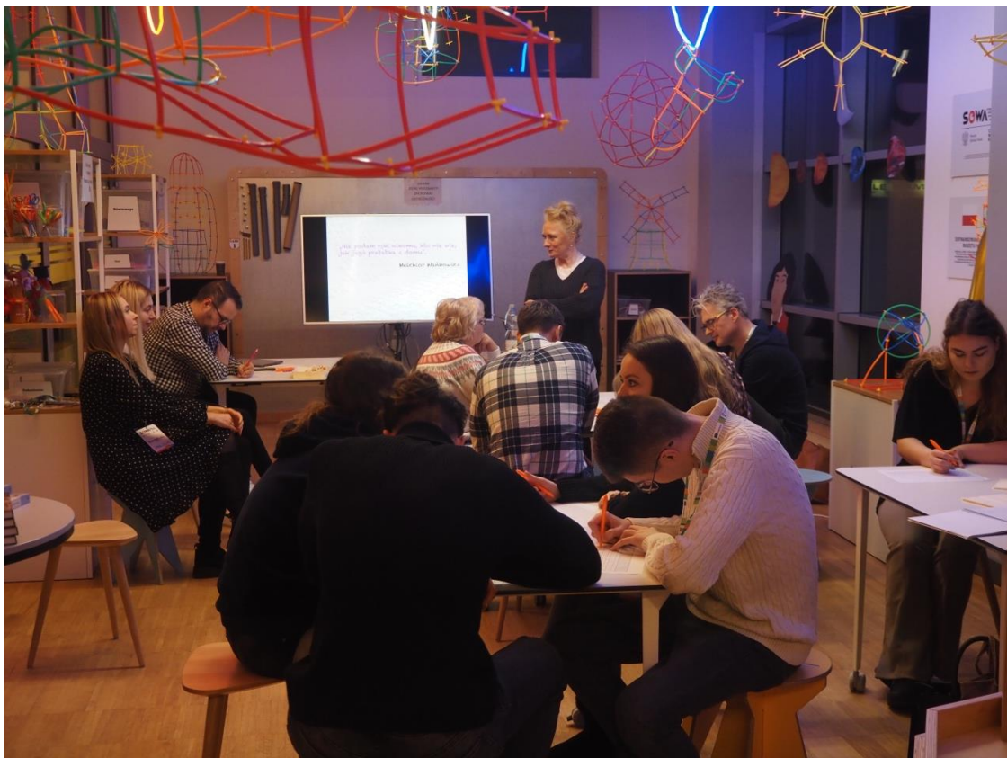
Fot. Poszukiwanie odpowiedzi na pytanie o uświadomione podobieństwo uczestników warsztatów do ich przodków.