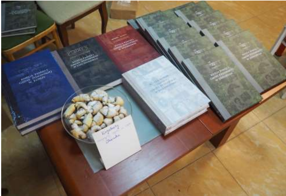
Fot. Pinkasy łomżyńskie ze słodkim rugelachami pani Krystyny Pogorzelskiej, korektorki współpracującej z ŁTN-em