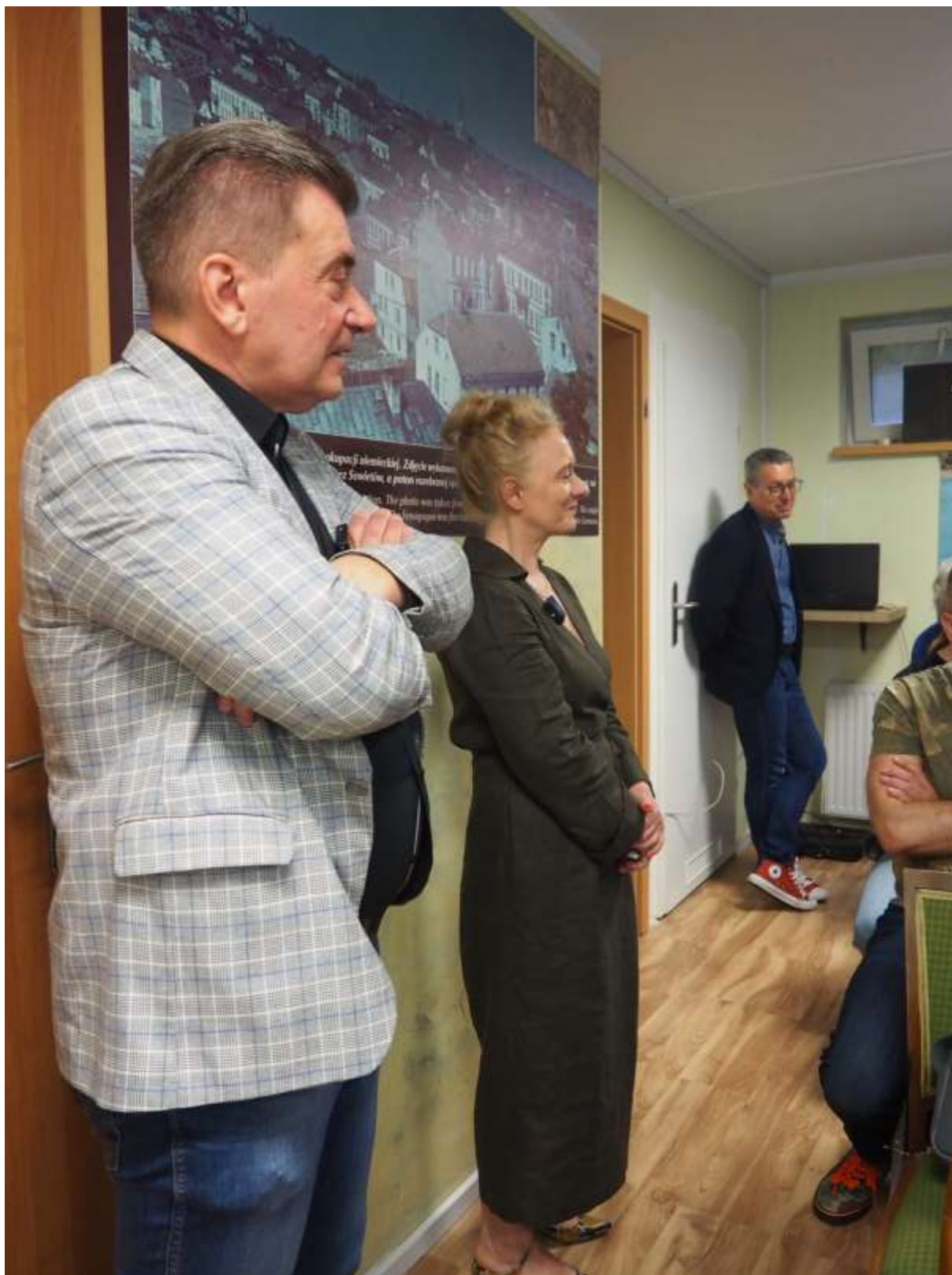
Fot. Rozmowy z uczestnikami promocji książki pamięci Jedwabnego