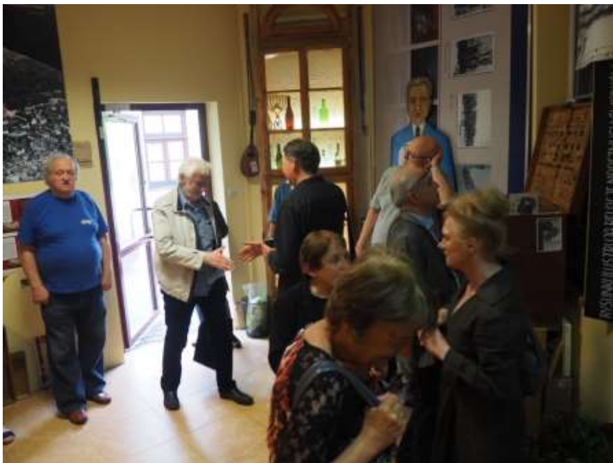
Fot. Rozmowy w kularach przed promocją