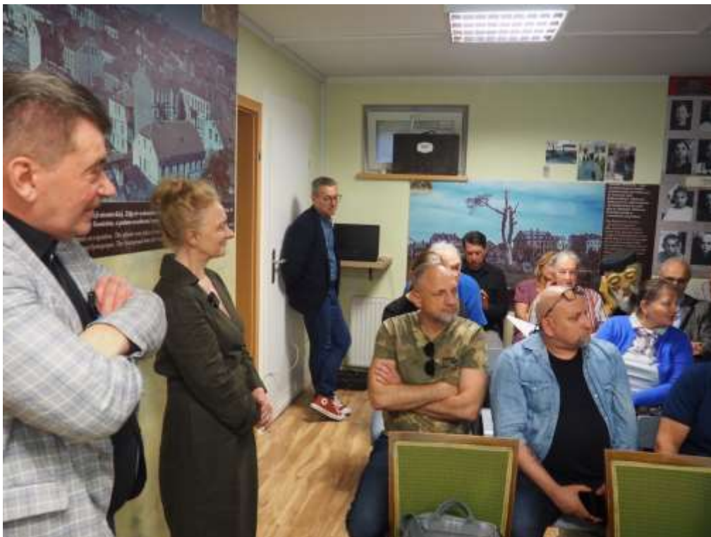
Fot. Rozmowy w czasie promocji