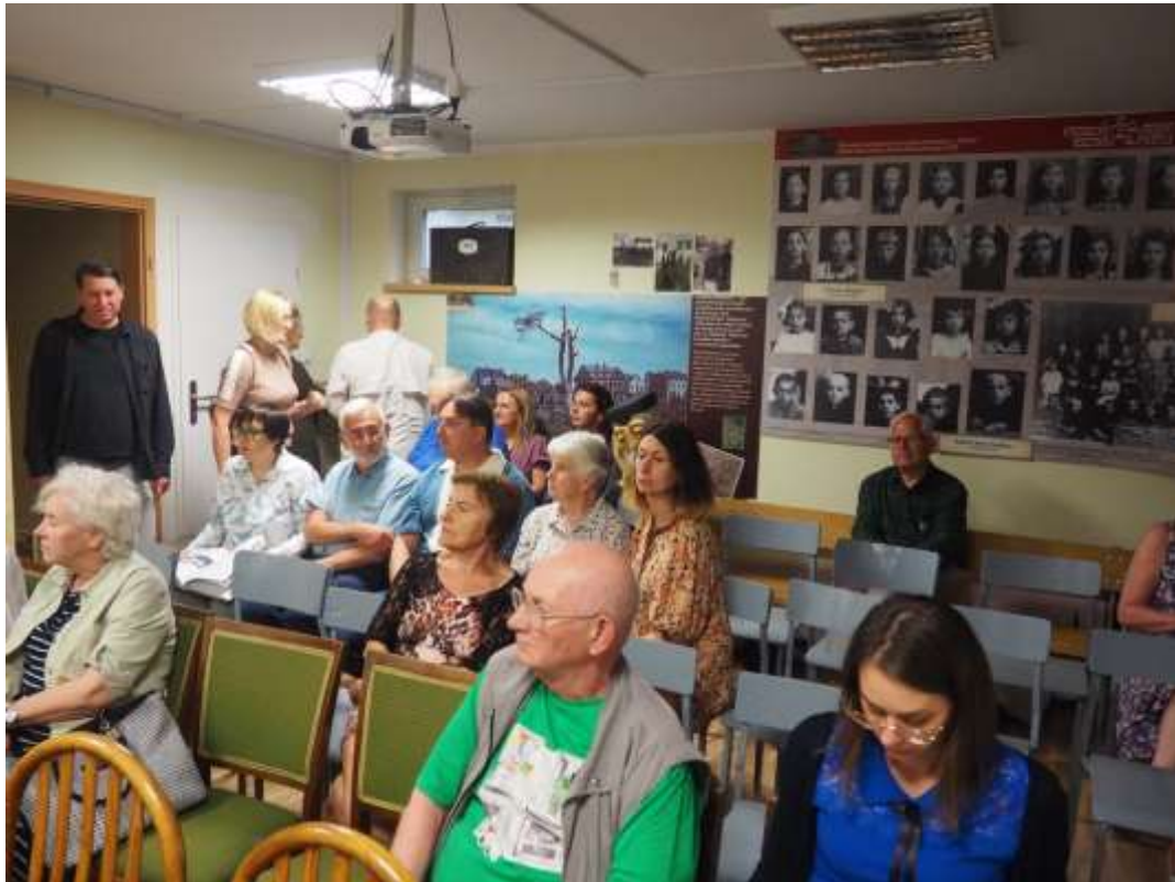
Fot. Publiczność dopisała