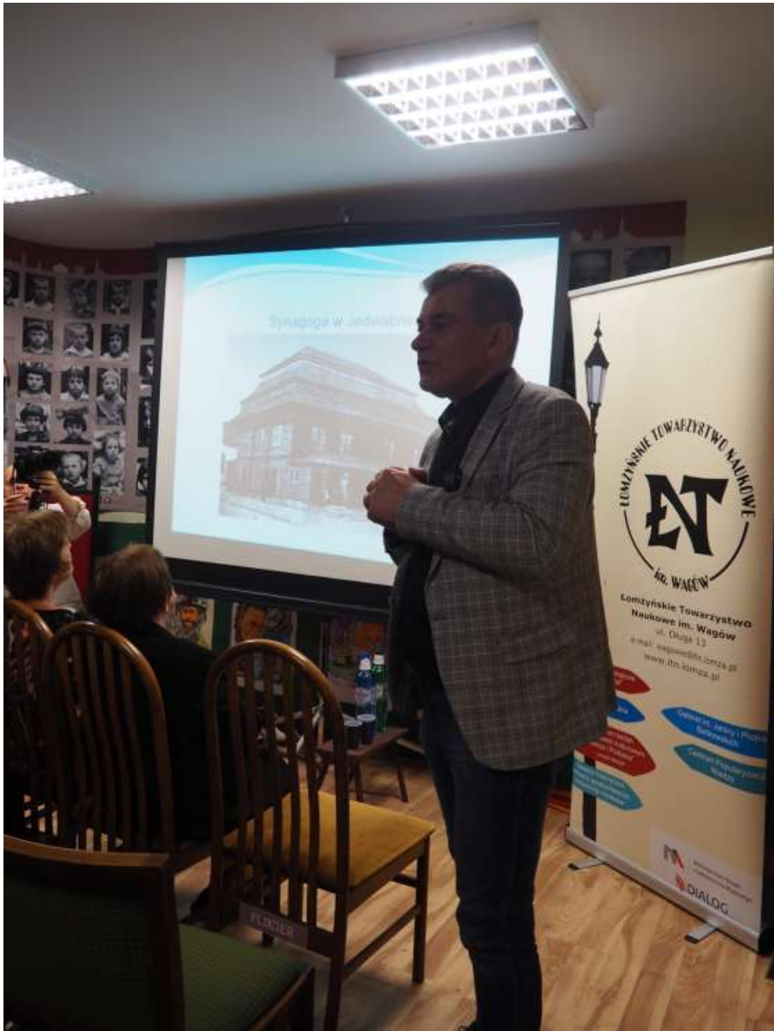
Fot. Dr Mirosław Reczko