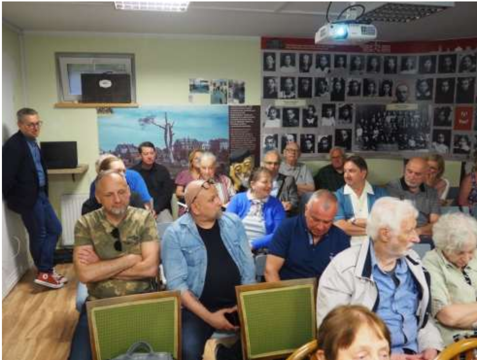
Fot. Publiczność z Białegostoku i sympatycy MIEJSCA