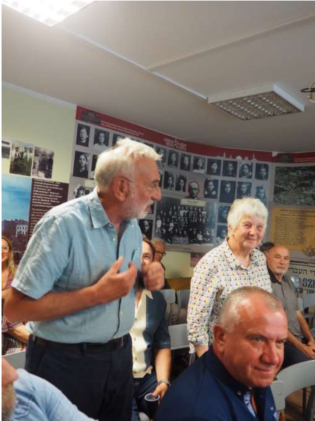
Fot. Goście z USA, potomkowie Żydów zambrowskich