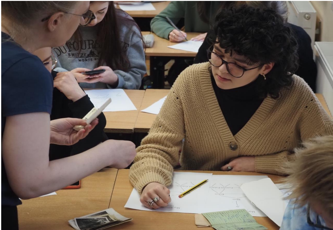
Przekaz rodzinny i pamiątki, jakie zostały po przodkach, to cenne źródło informacji.