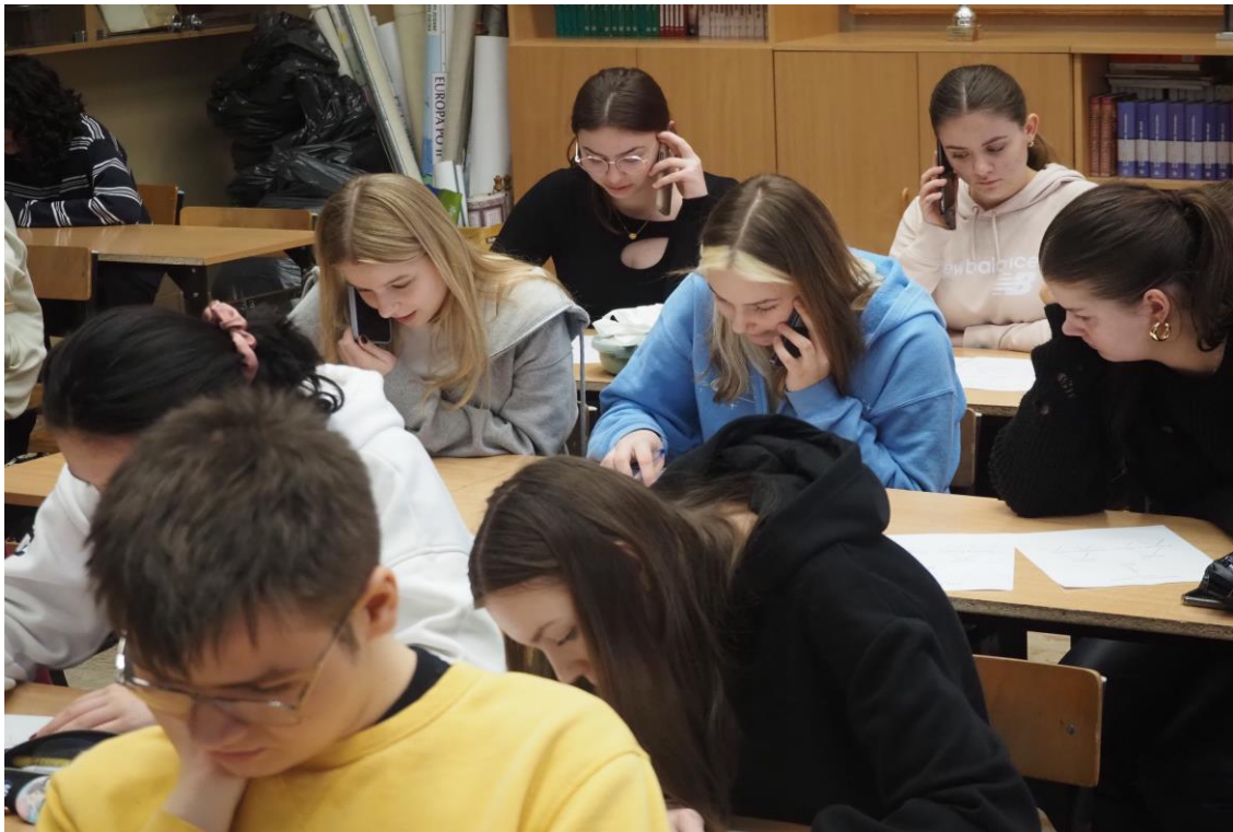
Telefon do rodziców lub dziadków wspierał efekt tworzenia pełniejszego drzewa genealogicznego.