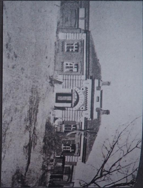
Lomża, Pre-burial house at the new Jewish cemetery