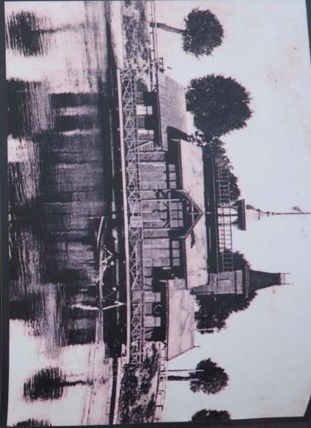
Rowing harbor in Lomza