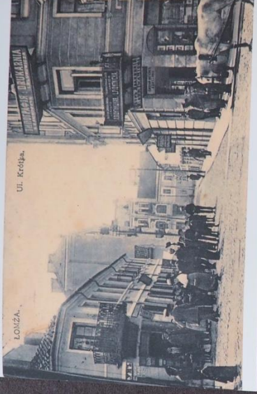
Lomza, the intersection of Długa Street and Królka Street