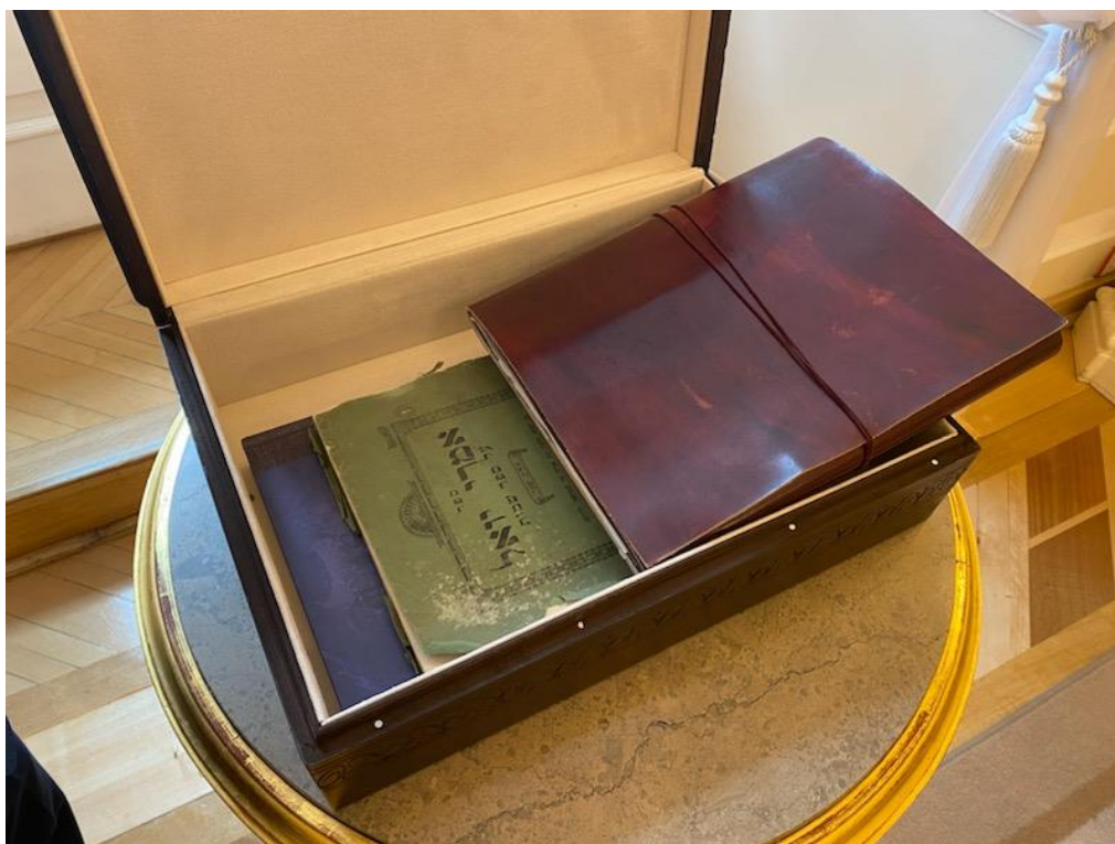
Fot. Pinkas Łomży i album spakowane do przekazania Prezydentowi Izraela

Wczoraj w czasie oficjalnego wystąpienia Prezydent Izrael Icchok Hercog wspomniał o swoich łomżyńskich korzeniach, co w kontekście jego przemowy było istotnym elementem wyrazu świadomości tego człowieka i historii Żydów polskich.